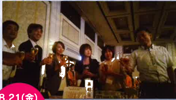
8.21(金) 福岡支部 総会